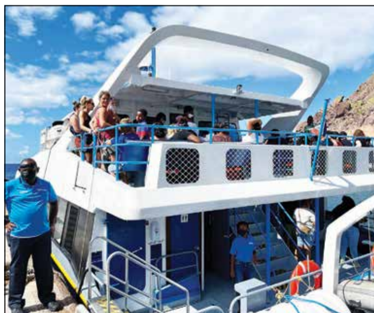
Makana na Saba Fort Bay Harbor.

tambe pa mira den e PSO pa proveé transportashon aéreo for di Karibe Hulandes. Komo ku esaki ta un trabou legal diferente, e lo tuma su tempu.